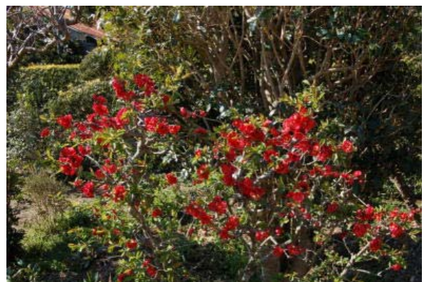
昨年の庭の花(ぼけ)