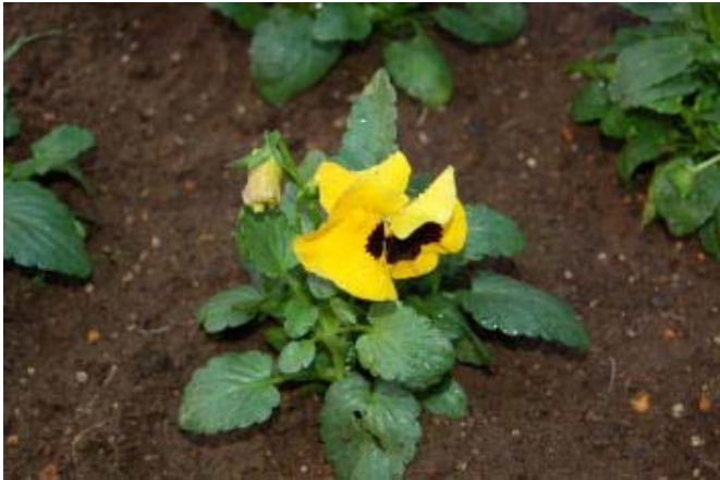
庭に植えていただきました